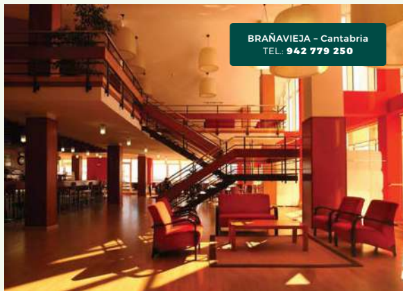
BRAÑAVIEJA - Cantabria TEL.: 942 779 250

SERVICIOS: restaurante, cafetería, salones sociales, disco-bar, terraza solarium, sauna, parking...